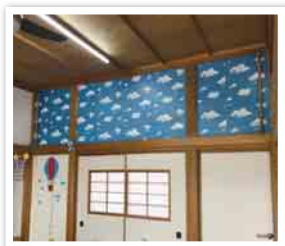
青空の壁紙はご自身で誕生日カードを貼っています