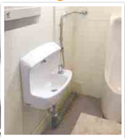
手洗いを小さなお子様でも使いやすい高さに