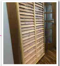
DIYがお好きなお主人お手製の建具も増設