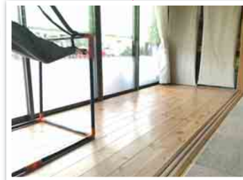
和室同様のパイン材の無垢フローリングで素足でも快適