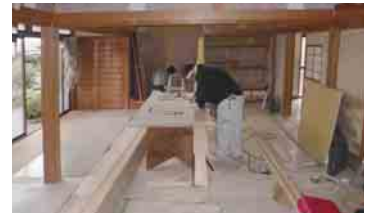
階段前に設置する建具作り風景

な場所にしていきたいですね。屋号の『いころ』とはアイヌ語で宝物という意味です。子供たちみんなが宝物、支えていくご家族をサポートし、必要とされる場所にしたいと思います。また改装するときは、ぜひ集さんにご相談させてもらいますので、これからもよろしくお願ひ致します(笑)!