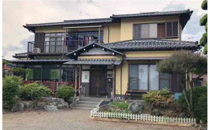
1階は障害児のための日中一時支援事業所

空き家をリフォームし、障害児のご家族の一時的な休息を目的とした場所として3年前にオープン。1階は障害児のための日中一時支援事業所、2階は居住スペースとなっています。K様ご自身も障害児を持つ親として「頼れる場所、自分が休める場所があったらいいな」という想いを抱いてきました。ご家族や周りの仲間の支えもあり、ついに実現！お子様をお預かりする場所として、どんなところがポイントになったのか伺ってきました。