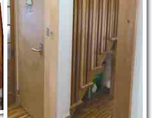
2階に上がらないために建具設置。頭が入らないように縦格子を造作