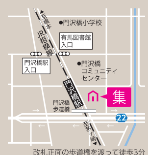
改札正面の歩道橋を渡って徒歩3分

様々な知恵や能力を持った人が集まる。楽しいことをしに、自然と人が集まる。「建築工房集」にこめられた、名の由来。それは、社長の理想と想いである。