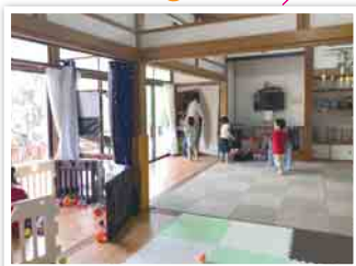
2部屋の和室を広々とした1部屋に。床は畳からパイン材の無垢フローリングに変更し安心安全な自然健康塗料を塗装。暗い印象の砂壁を部屋全体が明るく見える白い壁紙に変更