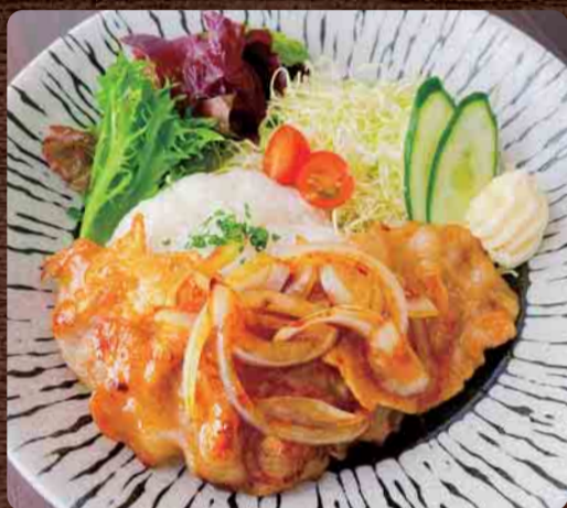
ポークジンジャー