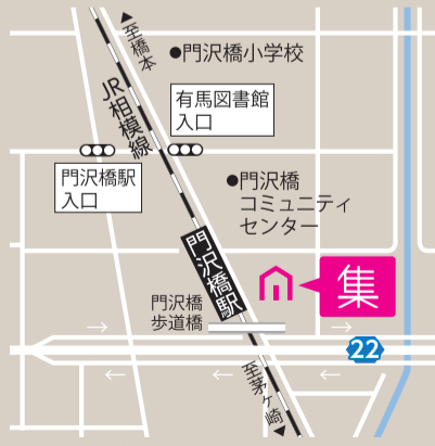
改札正面の歩道橋を渡って徒歩3分

様々な知恵や能力を持った人が集まる。 楽しいことをしに、自然と人が集まる。 「建築工房 集」にこめられた、名の由来。 それは、社長の理想と想いである。